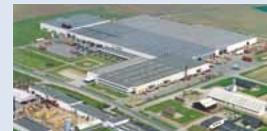
Danemark, Nørre Alslev