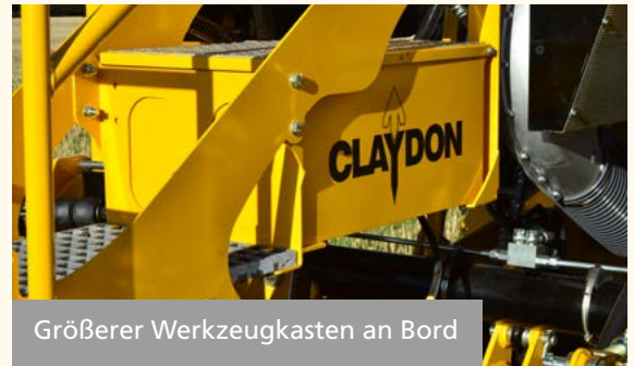
Größerer Werkzeugkasten an Bord