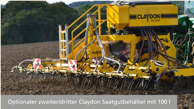
Optionaler zweiter/dritter Claydon Saatgutbehälter mit 100 l