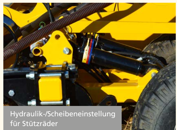
Hydraulik-/Scheibeneinstellung für Stützräder