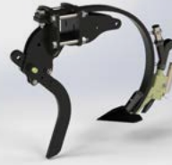
Saatzinken (Dünger wird über Saatgut ausgebracht)