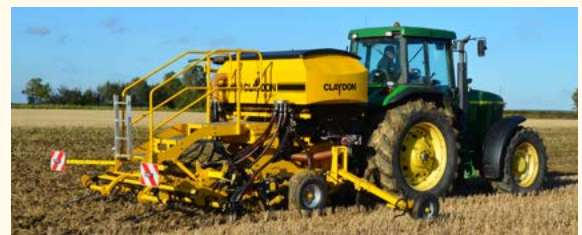
Saatgutbehälter mit höherer Kapazität: 1.900 l und 2.700 l