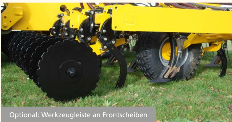
Optional: Werkzeugleiste an Frontscheiben