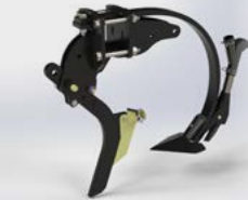
Frontzinken (Dünger wird unter Saatgut ausgebracht)