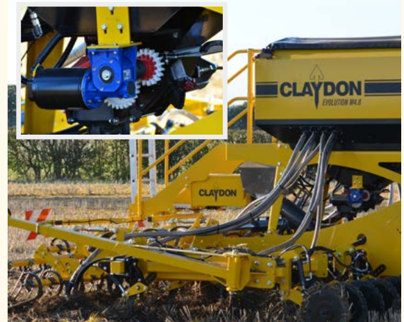
Leichter Zugang zu Kalibrierung, Schalttafel und Gebläse